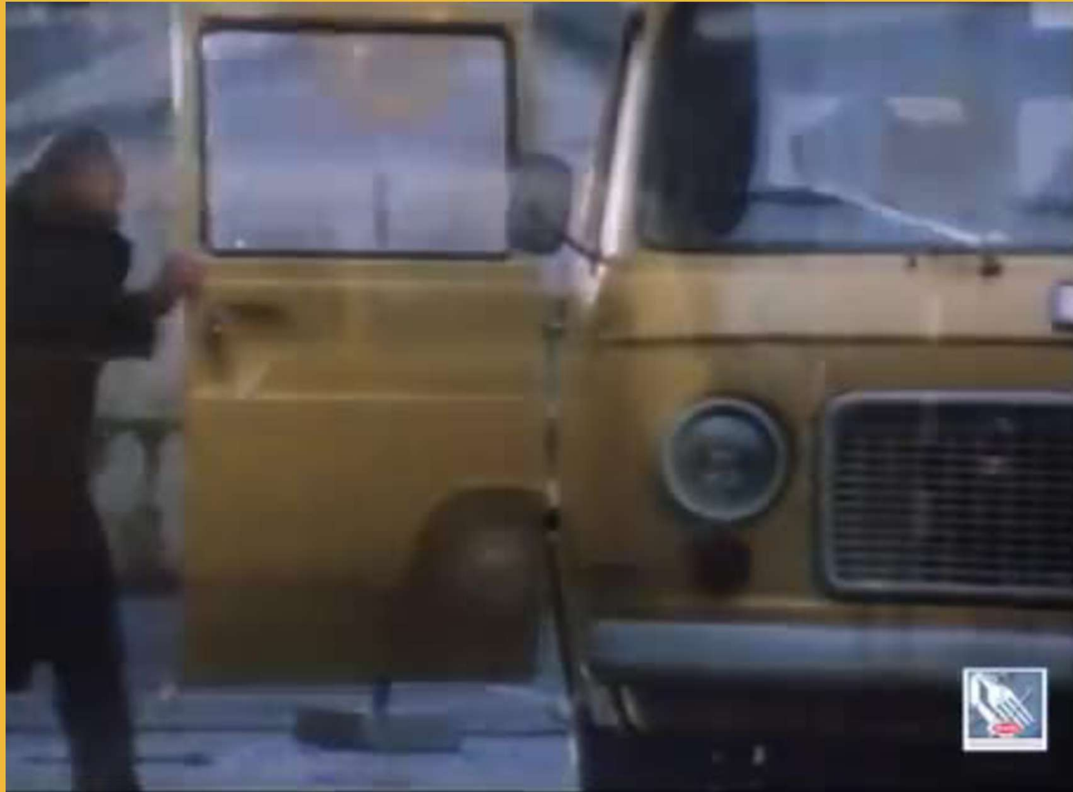
Spot Barilla - 1986