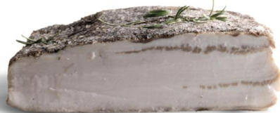
lardo di Colonnata Igp