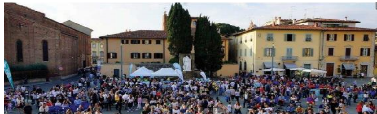
Prato Sport Show

Piazza Santa Maria delle Carceri 5 OTTOBRE ORE 15.30-18.30 Organizzazione a cura di CGFS