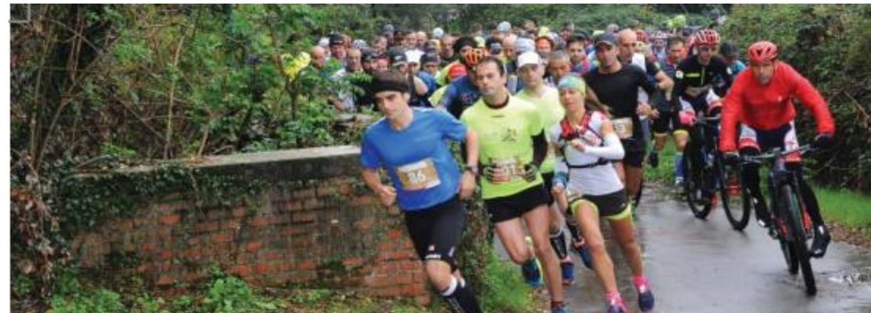
27 a Scarpirampì - 9 a Trail della Calvana