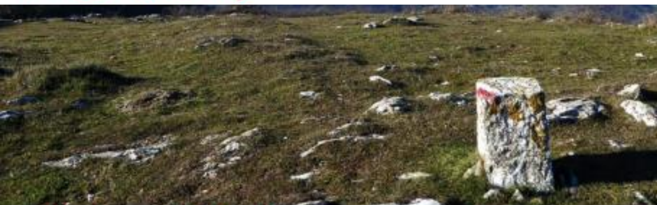
Sentieri della Memoria 13 a edizione