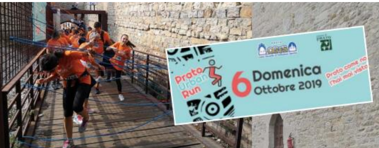
4 a Prato Urban Run

FORMAZIONE MANAGERIALE PER NUOVE COMPETENZE