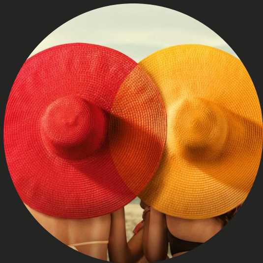
Il valore aggiunto di Mastercard nella PA