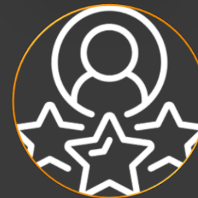
SUBJECT MATTER EXPERTS