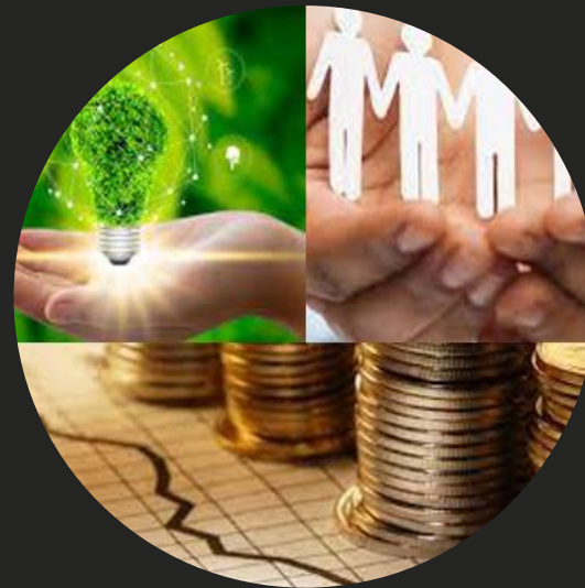
Dagli Insights alle possibili azioni