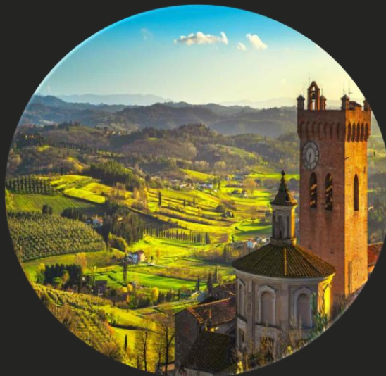
Il nostro progetto con Regione Toscana