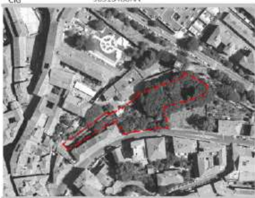
TAVOLA C /3.1 scala 1:100 ELABORATI GRAFICI - STATO DI PROGETTO IL GIARDINO DELLA VILLA